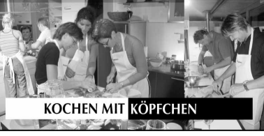
KOCHEN MIT KÖPFCHEN

Im Küchenstudio Schmalz an der Marienstraße 4 wird der Hobbykoch aus Kümmerbruck am Donnerstag, 25. November, ab 19 Uhr mit Lesern unserer Zeitung fünf Gänge zubereiten, die das Fest der Feste zu einem ku-