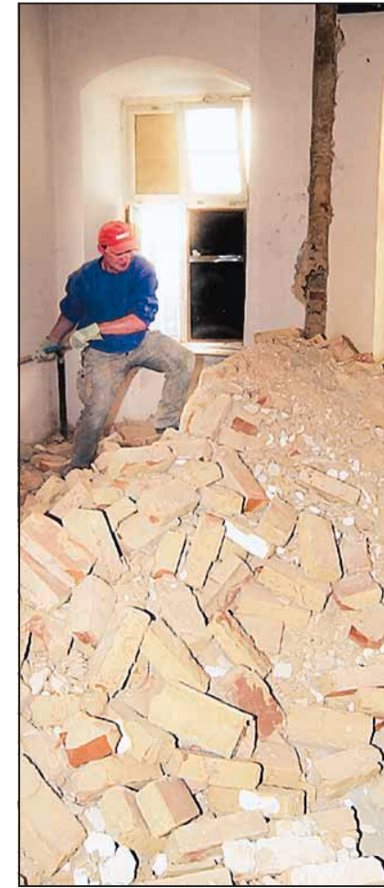
Bis September sollen die Schuttberge im ehemaligen Bergamt verschwunden sein: Größter Brocken bei der Sanierung ist der Einbau eines zusätzlichen Treppenhauses.