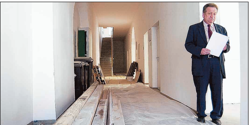
Schulleiter Franz Gleixner inspiziert das ehemalige Bergamtsgebäude, das im Jahr 1923 erbaut wurde. Seit 1. Mai gehört es zum Max-Reger-Gymnasium, ab September werden dort Schüler unterrichtet, damit im Hauptgebäude die Generalsanierung beginnen kann.

Die 150 000 Euro Sanierungskosten, die für den Umbau des ehemaligen Bergamtes anfallen, sind in dem Betrag von 6,6 Millionen Euro, die die Generalsanierung insgesamt verschlingt, inbegriffen.